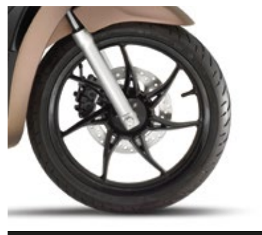
CERCHI DIAMANTATI NERI

La versione "S" esprime tutta l'energia del tuo carattere e il dinamismo delle tue giornate. Dettagli che dettano stile: la sella con le finiture esclusive, i cerchi con bordo diamantato e gli specchietti neri. Alla motorizzazione 50 cc si aggiungono le cilindratae 125 e 150 cc dotate di ABS solo sulla ruota anteriore, nei colori Marrone Terra, Bianco Luna, Grigio Materia e Nero Meteora per distinguerti con un tocco di stile.