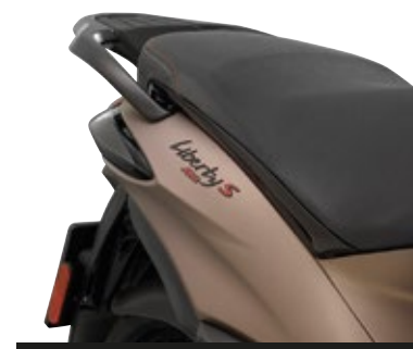
MANIGLIONE POSTERIORE NERO