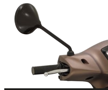
SPECCHIETTI RETROVISORI NERI